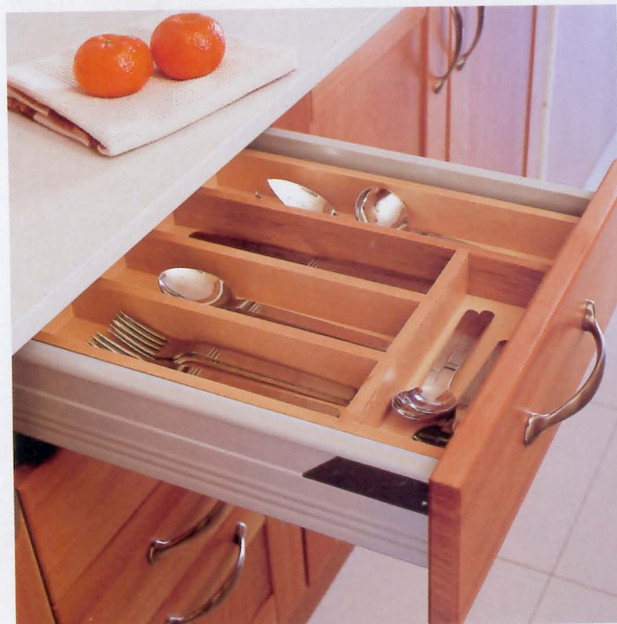
El mobiliario está realizado con cedro teñido y barnizado mate, y es un diseño de la decoradora. Cubertero de madera (4.255 ptas) de Blauddecor.