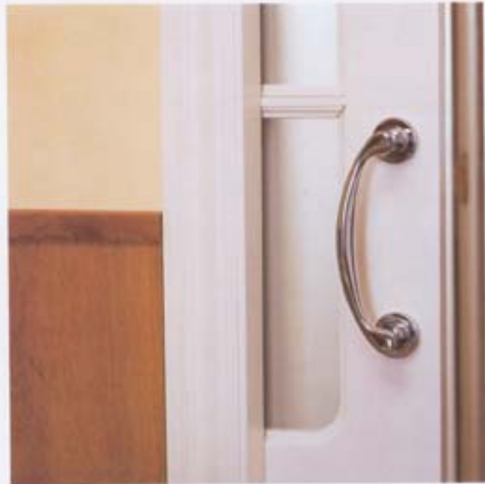
Una forma para aprovechar al máximo el espacio y aprovechar la luz del recibidor fue instalar una vidriera corredera. Tirador (7.000 ptas.) de Arcón.