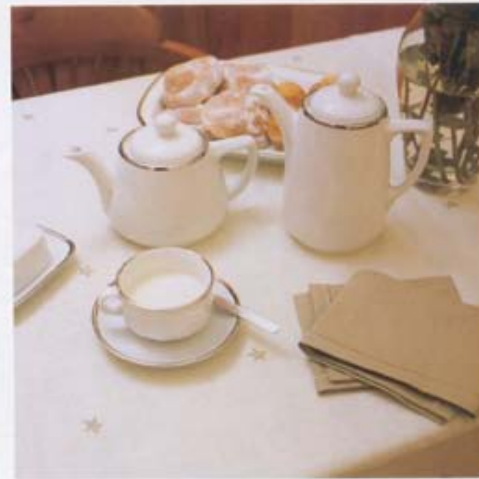
El office se ha equipado con una mesa rectangular para cuatro comensales. Juego de café modelo Walkure, de Pima. La cafetera cuesta 5.750 ptas.

tiempo, un contrapunto de claridad a tanta madera. Para el suelo eligió un gres porcelánico en color gris finamente punteado y, para la encimera y el antepecho, eligió piedra sintética de una tonalidad casi idéntica a la del pavimento. Una de las medidas adoptadas por la interiorista para no empequeñecer el espacio fue la de instalar una puerta corredera acristalada, lacada en blanco, que separa la cocina del recibidor y permite disfrutar de la luz que proviene del acceso a la casa sin restar espacio útil a la cocina.