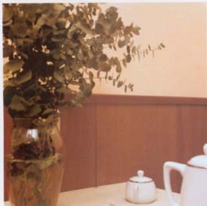
Para proteger la pared del office se ha instalado un decorativo arriadero de madera de cedro. Tiene un precio de 18.000 ptas/m 2 , en Blaudecor.