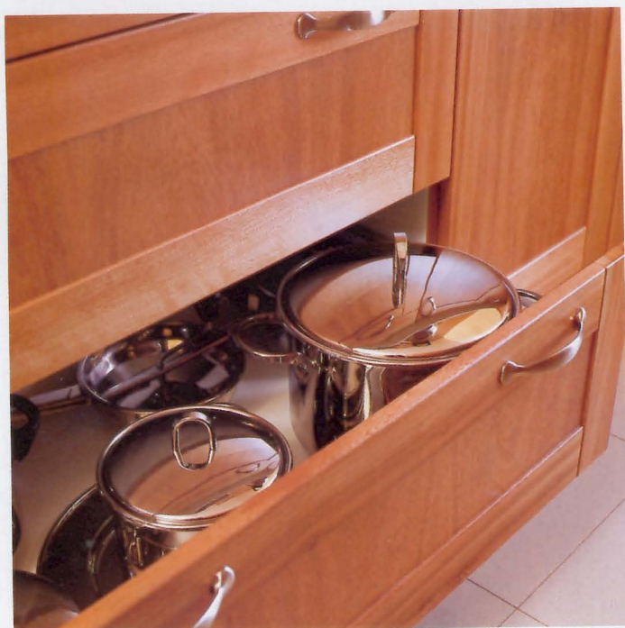
La cocina está equipada con cajones de gran capacidad para guardar los utensilios de mayor tamaño. Cazuelas Scandia, en Pilma (15.045 ptas/u).