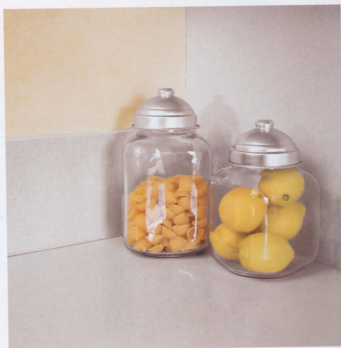
Tanto la encimera como el antepecho de la zona de trabajo son de Silestone blanco norte. En Mármoles Creusmar vale 45.000 ptas/m 2 .