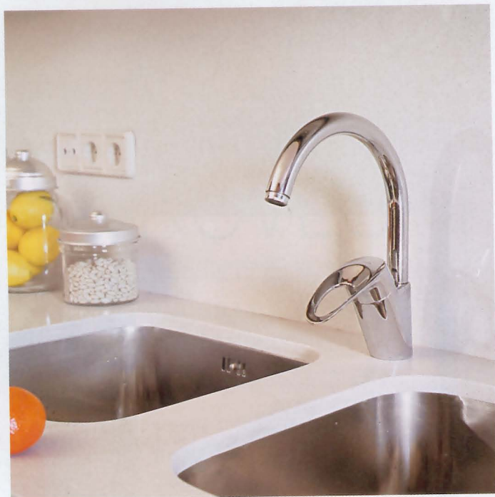
La grifería es el modelo Logica, de Roca (18.000 ptas) y se adquirió en Blauddecor. Los fregaderos de acero son de Franke (15.800 ptas/u).