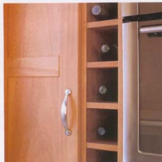
En el frente de armarios dedicado a despensa se han instalado un botellero en columna, el microondas (73.600 ptas.) y el horno (97.300). De Balay.